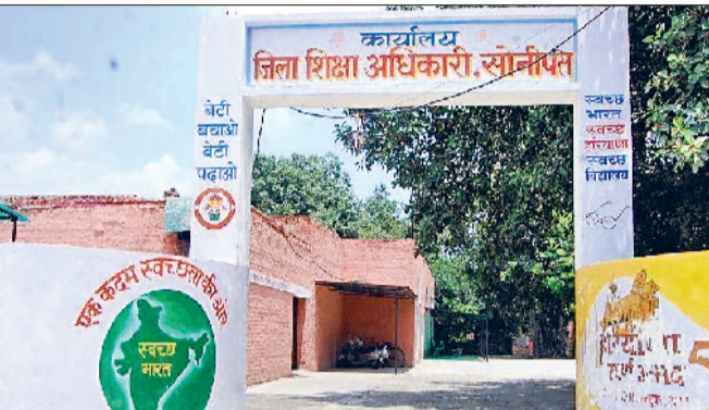
सोनीपत। सेक्टर-14 स्थित जिला शिक्षा विभाग का कार्यालय।

निशुल्क व अनिवार्य बाल शिक्षा का अधिकार (आरटीई) अधिनियम के तहत विद्यार्थियों का निजी स्कूलों में दाखिला करवाने को लेकर विद्यालय शिक्षा निदेशालय की ओर से शेड्यूल में बदलाव किया गया है। नए शेड्यूल के मुताबिक जिले के मान्यता प्राप्त निजी स्कूलों में बच्चों का दाखिला करवाने के लिए अभिभावक 16 अप्रैल तक ऑनलाइन उच्चल पोर्टल पर आवेदन कर सकेंगे। इसके पश्चात 20 अप्रैल को ड्रा के माध्यम से विद्यार्थियों को स्कूल अलॉट किए जाएंगे, जबकि पहले 9 अप्रैल को ड्रा निकाला जाना था। इस वर्ष 21 से 30 अप्रैल तक दाखिला प्रक्रिया चलेगी। पहले 10 से 23 अप्रैल तक दाखिला लेने की तिथि निर्धारित की गई थी। वहीं निदेशालय ने 1 से 5 मई तक वेटिंग लिस्ट के आधार पर बच्चों का दाखिला करवाने का निर्णय लिया है। उधर जिला शिक्षा विभाग कितने स्कूलों की ओर से सीटें जारी की गई है या कितने स्कूल निदेशालय के निर्देशों पर दिलचस्पी ले रहे हैं, इस बात से अनजान बना है। विभाग के पास अब तक ऐसा कोई विवरण नहीं है। अधिकारियों के अनुसार आरटीई अधिनियम 2009 के तहत सभी मान्यता प्राप्त निजी स्कूलों को अलाभप्रद व आर्थिक रूप से कमजोर वर्ग के बच्चों के लिए नर्सरी, केजी व प्रथम कक्षा के लिए 25 प्रतिशत सीटें आरक्षित करनी होती है।